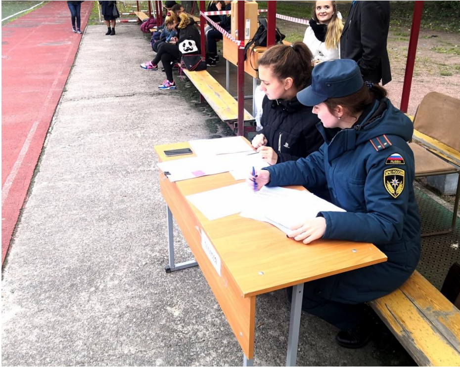
ОНДПР Центрального района 27.09.2019